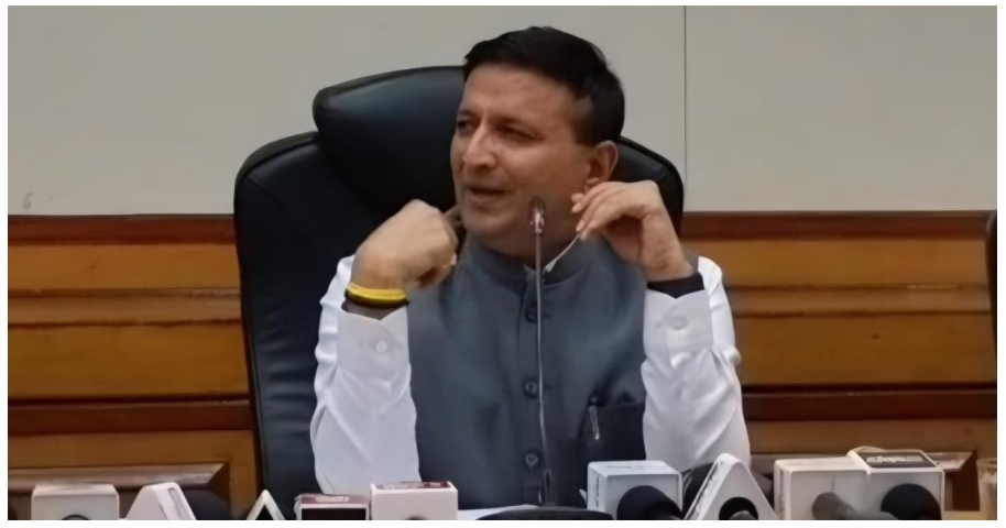
महाविद्यालय मंडळाच्या स्थापनेच्या १२५ वर्षांच्या निमित्ताने या स्पर्धेचे आयोजन करण्यात येत असल्याची