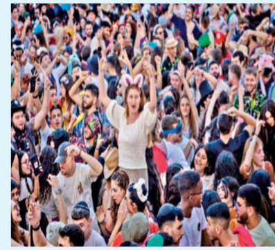
त्याचबरोबर तिथे सामाजिक एकजूट मोठ्या प्रमाणावर दिसते. संकटाच्या काळात लोक एकमेकांना मदत करतात. आपल्याला काहीही झालं, आपला देश कितीही संकटात असला तरीही

आपण एकटे पडणार नाही आणि समाज, सरकार आपल्या पाठीशी उभं राहील हे त्यांना ठाऊक आहे. हीच भावना त्यांच्या आनंदाच्या पातळीला आधार देते. दुसरी महत्त्वाची गोष्ट 'रेझिलिअन्स' - म्हणजेच प्रतिकूल परिस्थितीतून सावरण्याची क्षमता. इस्रायलचे नागरिक अनेक दशकांपासून संघर्षाला सामोरे जात आहेत, त्यामुळे मानसिकदृष्ट्या ते अधिक सक्षम झाले आहेत. म्हणूनच बाह्य संकट आलं तरी त्यांच्या दैनंदिन आयुष्यातील समाधानावर त्याचा तितका परिणाम होत नाही. उलट, संकटात एकजूट वाढते आणि समाज अधिक मजबूत बनतो. याउलट, अनेक विकसित देशांमध्ये आर्थिक प्रगती असूनही सामाजिक एकटेपणा, तणाव आणि सोशल मीडियाचा वाढता प्रभाव यामुळे आनंदाची पातळी घसरताना दिसते.