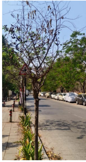
व संरक्षण म्हणजे उद्याच्या पिढीसाठी ऑक्सिजनची हमी आहे; मात्र प्रत्यक्षात झाडांची अशी