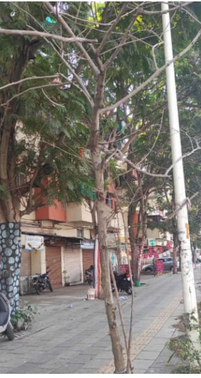
अवस्था होत असेल तर हे दुर्दैवी आहे," असे म्हटले. त्यांनी उद्यान विभागाचे तातडीने लक्ष देऊन झाडे