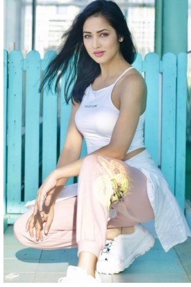
क्लीन्सरचा वापर करून त्वचा स्वच्छ ठेवतात. "सनस्क्रीन हा माझ्या रूटीनचा सर्वात