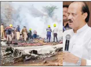
VSR कंपनी, अधिकाऱ्यांवर कारवाई होईपर्यंत नव्या नियमांना अर्थ नाही

अजित पवारांच्या विमान अपघातानंतर डीजीसीए अर्थात नागरी हवाई वाहतूक महासंघानाला नवीन व्हीआयपी व्यक्तीच्या हवाई प्रवासाच्या सुरक्षेविषयी नव्या गाईडलाईन्स जाहीर केल्या आहेत. राष्ट्रवादी काँग्रेस शरदचंद्र पवार पक्षाचे आमदार रोहित पवार यांनी या गाईडलाईन्सवर प्रश्नचिन्ह उपस्थित केले आहे. डीजीसीएने व्हीएसआर कंपनीसह संबंधित अधिकाऱ्यांवर कारवाई केली तर नव्या गाईडलाईन्सला अर्थ आहे, अन्यथा त्या केवळ एक दिखावा ठरतील, असे त्यांनी म्हटले आहे. अजित पवार यांचे गत २८ जानेवारी रोजी बारामती येथील एका विमान अपघातात निधन झाले. तेव्हापासून