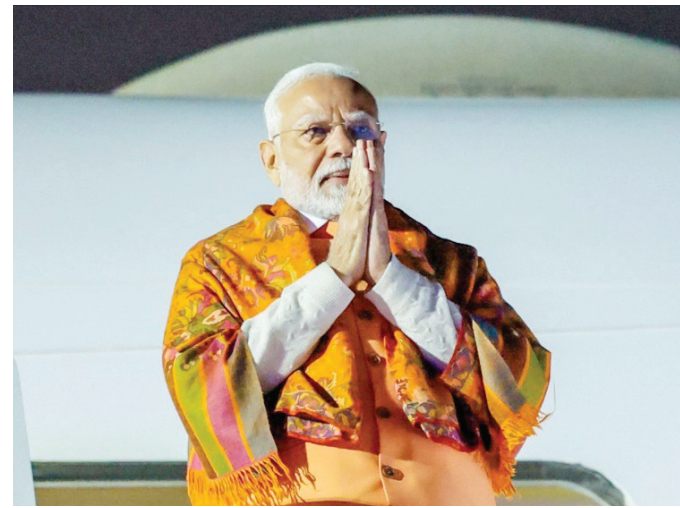
आहे. उद्घाटनानंतर झालेल्या सभेत मोदींनी पश्चिम आशियातील युद्धाच्या

पंतप्रधान नरेंद्र मोदी यांनी उत्तर प्रदेशातील जेवर येथे नोएडा आंतरराष्ट्रीय विमानतळाच्या पहिल्या टप्प्याचे उद्घाटन केले. हा विमानतळ सध्या भारतातील सर्वात मोठा आणि आशियातील दुसऱ्या क्रमांकाचा विमानतळ ठरणार असून, पूर्ण झाल्यानंतर आशियातील सर्वात मोठा विमानतळ बनेल.