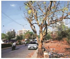
धोक्यात आले आहे. त्यामुळे काही झाडे मरणासन्न अवस्थेत येऊ लागल्याचे चित्र दिसून येत आहे. त्यामुळे वृक्षप्रेमी नागरिकांतून नाराजी व्यक्त होत आहे. शहरात तब्बल ३२ लाख झाडे असल्याचे वृक्षगणनेतून उघड झालेले आहे. झाडांच्या चांगल्या वाढीसाठी झाडांच्या बुंध्याला एक मीटर चौरस माती असावला हवी. परंतु शहरात ठिकठिकाणी झाडांना सिमेंट काँक्रीटचे आवरण केले जात आहे.

पिंपरी-चिंचवड शहरातील अनेक सिमेंट व डांबरी रस्त्यांच्या मार्गट असलेल्या झाडांच्या बुंध्याभोवती पुरेशी मोकळी जागा न सोडल्याने शहरातील अनेक झाडांचे अस्तित्व धोण्यात आल्याचे दिसून येत आहे. झाडांच्या बुंध्याभोवती जागा मोकळी न केल्याने झाडांचा श्वास कोंडू लागला आहे. सिमेंट, डांबरी रस्त्यांची कामे, अर्बन स्टीटनुसार पदपथ विकसित करताना रस्त्यालगत असलेल्या बहुतांश झाडांच्या बुंध्याभोवती कंत्राटदारांनी सिमेंटचे आवरण केल्याचे सर्रास दिसत आहे. यामुळे झाडांना पाणी टाकता येत नाही. मुळांना व्यवस्थित पाणी मिळत नसल्याने झाडांचे अस्तित्त्वच