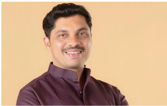
त्यानुसार सर्व संबंधित विभागांनी समन्वय साधून कार्यवाही करावी, असे स्पष्ट निर्देश महापौरांनी दिले.