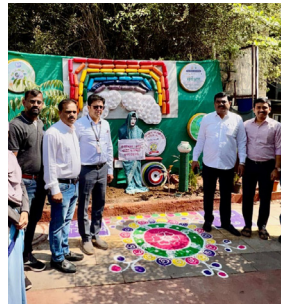
सुंदर केली. या माध्यमातून महिला सक्षमीकरणाचा प्रभावी संदेशही देण्यात आला. या सुशोभीकरण उपक्रमाचे उद्घाटन महानगरपालिकेचे अधिकारी, नगरसेवक, सोसायटी पदाधिकारी, ज्येष्ठ नागरिक तसेच स्थानिक नागरिक आणि दुकानदार यांच्या हस्ते करण्यात आले. हा उपक्रम

पिंपरी-चिंचवड महापालिकेच्या 'ग' क्षेत्रीय कार्यालयांतर्गत प्रभाग क्रमांक २७ मधील रहाटणी-श्रीनगर परिसरात एक अभिनव उपक्रम राबविण्यात आला आहे. तमारा सोसायटी, नखाते चौक परिसरातील सार्वजनिक जागेचे टाकाऊ वस्तूंच्या कल्पक वापराने आकर्षक सुशोभीकरण करण्यात आले आहे. या उपक्रमात सफाई कर्मचाऱ्यांनी केवळ स्वच्छता न करता टाकाऊ टायर, पाइप, प्लास्टिक बॉटल्स, फायबर पुतळे तसेच RRR सेंटरमध्ये जमा होणाऱ्या साड्या व अलंकारिक वस्तूंचा वापर करून रस्त्याकडील जागा आणि सार्वजनिक ठिकाणे