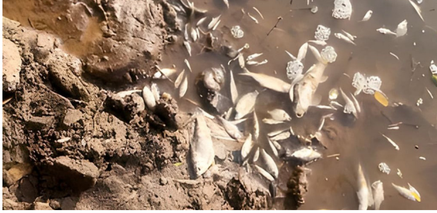
खराब झाल्याची खंत ग्रामस्थ व्यक्त करीत आहेत. साखर कारखाना

बारामती तालुक्यातील कोऱ्हाळे खुर्द येथील निरा नदीचे पाणी कमालीचे प्रदूषित झाले आहे. त्यामुळे लाखो मासे मृत झाले आहेत. पात्रालगत या माशांचा अक्षरशः खच पडला, तर पात्रातही हजारो मासे तडफडताना दिसतात. मृत माशांमुळे परिसरात दुर्गंधी पसरली आहे. या पाण्यामुळे शेती नापीक होत आहे. कोऱ्हाळे खुर्द येथे बंधाऱ्याच्या वरच्या बाजूस पाणी अतिशय अस्वच्छ बनले आहे. या पाण्याने शेती नापीक होत आहे. एकेकाळी पिण्यास योग्य असलेले निरेचे पाणी आता पूर्णतः