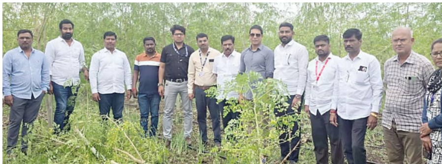
कृषी तथा मंडल अधिकारी यांना ताबडतोब पंचनामे करून अहवाल पाठवण्याचे निर्देश देऊन जास्तीची