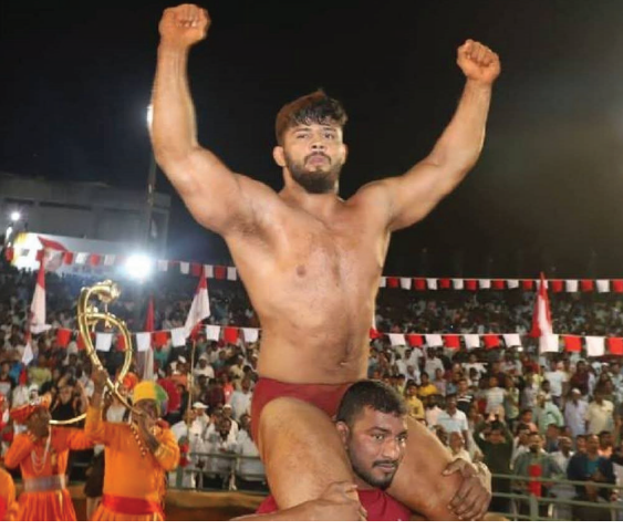
लाख,एक लाख आणि 51 हजार रुपयांच्या प्रमुख कुस्त्या पार