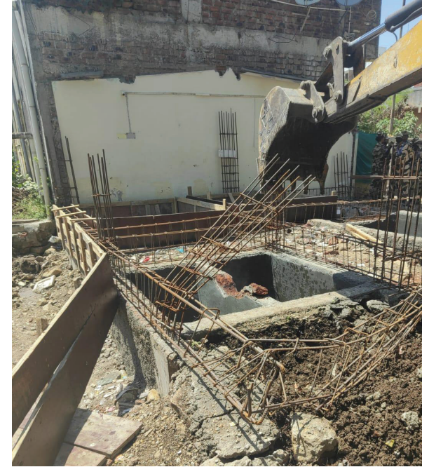
'फ' क्षेत्रीय कार्यालयामार्फत दि. १६ एप्रिल रोजी चिखली येथील प्राईम पार्क, शेला वस्ती

२१,७९८ चौरस फूट क्षेत्रफळावरील अतिक्रमण हटविण्यात आले. 'क' क्षेत्रीय कार्यालयामार्फत दि. १६ एप्रिल रोजी प्रभाग क्र. ६ भोसरी, सद्दूरुनगर परिसरात ३ अनधिकृत पत्राशेड (१६२ चौरस फूट) तसेच प्रभाग क्र. २ पुणे-नाशिक महामार्ग, बोन्हाडेवाडी परिसरात ४ पत्राशेड (१,५५० चौरस फूट) यावर निष्कासन कारवाई करण्यात आली. तसेच दि. १७ एप्रिल रोजी प्रभाग क्र. ६ भोसरी, सद्दूरुनगर परिसरातील ३ अनधिकृत आरसीसी बांधकामांवर कारवाई करून सुमारे २,०९९ चौरस फूट क्षेत्रफळ मोकळे करण्यात आले. 'ई' क्षेत्रीय कार्यालयांतर्गत दि. १७ एप्रिल रोजी प्रभाग क्र. ०३ मौजे मोशी/डूडूळगाव येथे धडक कारवाई पथकाद्वारे १ अनधिकृत पत्राशेड बांधकामांवर कारवाई करण्यात आली. या कारवाईत अंदाजे ६५० चौरस फूट क्षेत्रफळावरील अतिक्रमण हटविण्यात आले.