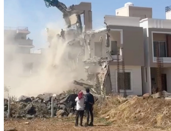
अलीकडे प्रारूप आराखडा तयार झाला असला तरी तो अद्याप अंतिम नसल्याने नागरिकांच्या