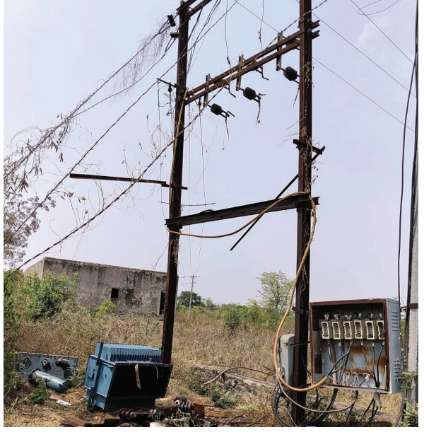
फोडून त्यातील तांब्याच्या तारांवर डल्ला मारला. तसेच रोहित्रातील