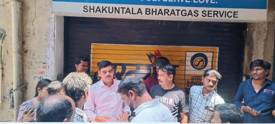
उरण तालुक्यातील २० हजार धारकांना घरगुती गॅस सिलिंडरचे वितरण हे शकुंतला भारत गॅस एजन्सी करत आहे.परंतु सदर एजन्सी विरोधात अनेक तक्रारी प्राप्त होत असल्याने सदर शकुंतला भारत गॅस एजन्सी विरोधात कारवाई करण्यात आली आहे.