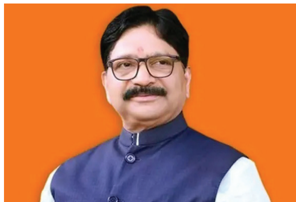
खासदार रविंद्र वायकर

ओशिवरा येथील नामांकित सिटी इंटरनॅशनल स्कूल प्रशासनाने शाळा अचानक बंद करण्याचा शाळा प्रशासनाने एकतर्फी निर्णय घेतल्यामुळे शेकडो विद्यार्थ्यांचे शैक्षणिक वर्ष धोक्यात आल्याने, शाळा प्रशासनावर फौजदारी तसेच प्रशासकीय कारवाई करण्यात यावी, अशी मागणी मुंबई उत्तर पश्चिम लोकसभा क्षेत्राचे खासदार रविंद्र वायकर यांनी शालेय शिक्षण मंत्री दादा भुसे यांच्याकडे पत्राद्वारे केली आहे. ओशिवरा आणि गोंरेगाव परिसरातील अनेक विद्यार्थी या शाळेत अनेक वर्षांपासून शिक्षण घेत आहेत. प्रवेशाच्या वेळी शाळा प्रशासनाने पालकांकडून ४०,००० रुपये 'देगणी' स्वरूपात स्वीकारले होते आणि इयत्ता १० वी पर्यंत विनाअडथळा शिक्षण देण्याचे आश्वासन दिले होते. मात्र, आता