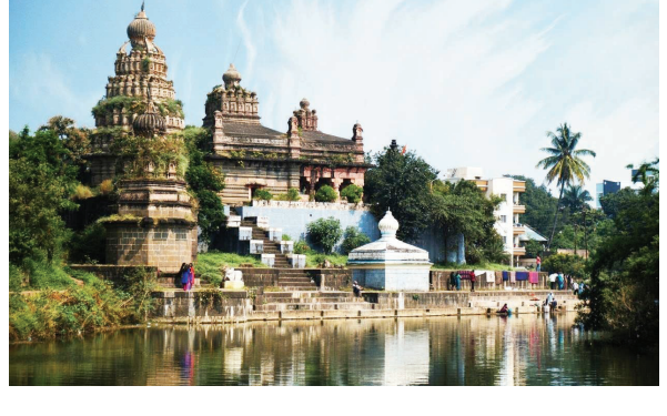
कऱ्हा पुत्र समितीचा पुढाकार

थंड हवेचे शहर म्हणून ओळख असलेल्या सासवडचा पारा यावर्षी ४० अंश सेल्सिअसपर्यंत पोहोचला आहे. या वाढत्या उष्णतेवर मात करण्यासाठी आणि पर्यावरणाचे संतुलन राखण्यासाठी 'कऱ्हा पुत्र नदी संवर्धन समितीच्या वतीने कऱ्हा नदीकाठी 'बांबू बेट' पुनरुज्जीवन मोहीम राबवण्यात येणार आहे. पूर्वी कऱ्हा नदीच्या दोन्ही पात्रांच्या कडेला बांबूची दाट नैसर्गिक बेटे होती. ही बेटे जमिनीतील ओलावा टिकवून ठेवण्यासोबतच पाण्याचे बाष्पीभवन रोखण्यास मदत करत असत. मात्र, काळच्या ओघात ही वृक्षसंपदा नष्ट झाल्यामुळे सासवडच्या तापमानात विक्रमी वाढ झाली आहे. बांबूची