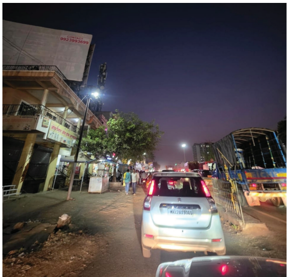
बंद केलेल्या दुभाजकाच्या पुढील कुंजीरवाडी चौकात महामार्गावर दररोज ४ ते ५ किलोमीटरपर्यंत वाहनांच्या लांबच लांब रांगा लागत आहेत. पर्यायी दुभाजक व सेवा रस्त्यांचे योग्य नियोजन न केल्याने कामगार, विद्यार्थी आणि रुग्णवाहिकांना तसेच लग्नाला

पुणे-सोलापूर महामार्गावरील नायगाव फाटा चौक येथील दुभाजक बंद केला खरा पण फसलेल्या नियोजनामुळे कुंजीरवाडी चौकात प्रचंड वाहतूक कोंडी होत असून साधारण ४ ते ५ किलोमीटर पर्यंत वाहतूक कोंडी दिसून येत आहे. त्यामुळे प्रशासनाने पर्यायी व्यवस्था न करताच कुणाला खुष ठेवण्यासाठी व नागरिकांचे हाल करण्यासाठी हा दुभाजक बंद केला आहे. अशी चर्चा नागरिकांमध्ये चालू आहे. पुणे - सोलापूर महामार्गावरील नायगाव फाटा येथील दुभाजक बंद करण्याचा प्रशासनाच्या निर्णयामुळे वाहनचालक त्रस्त झाले आहेत. वाहतूक कोंडीला व अपघातांना आळा बसण्याच्या उद्देशाने घेतलेल्या या निर्णयामुळे