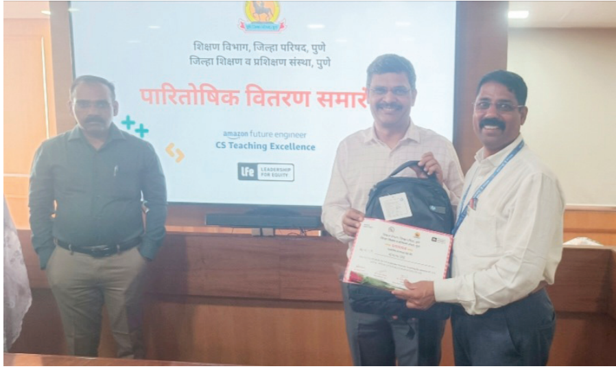
होती. त्यापैकी १७६ शिक्षकांनी हा खडतर कोर्स यशस्वीपणे पूर्ण केला आहे. या सर्व यशस्वी शिक्षकांचे जिल्हा प्रशासनाच्या वतीने अभिनंदन करण्यात आले. या कार्यक्रमात राजगड