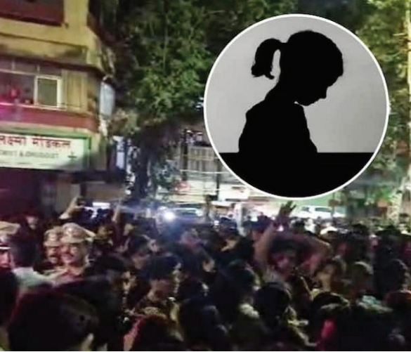
टाकण्याच्या माझ्या बापाला फाशी द्या, अशी संतप्त मागणी मुलीच्या आईने केली. ते बुधवारी पुण्यात प्रसारमाध्यमांशी बोलत होते. या सगळ्या घटनेविषयी बोलताना मुलीच्या आई-वडिलांनी

नसरापूरमधील चिमुर्ड्या मुलीच्या अत्याचार आणि हत्येची घटना ताजी असतानाच पुणे शहरातील पर्वती भागात असाच एक चीड आणणारा प्रकार घडल्याची माहिती समोर आली आहे. पर्वती येथील एका ७० वर्षांच्या वृद्धाने आपल्या स्वतःच्या नातीवरच अत्याचाराचा (Rape) प्रयत्न केला. या मुलीचे आई-वडील हे कामाला जातात. ते घरी नसताना या वृद्धाने घरातच नातीवर अतिप्रसंग (Sexual Assault) करण्याचा प्रयत्न केला. याविषयी बोलताना मुलीच्या पालकांनी संताप झाला पाहिजे. माझ्या मुलीच्या अंगावर हात