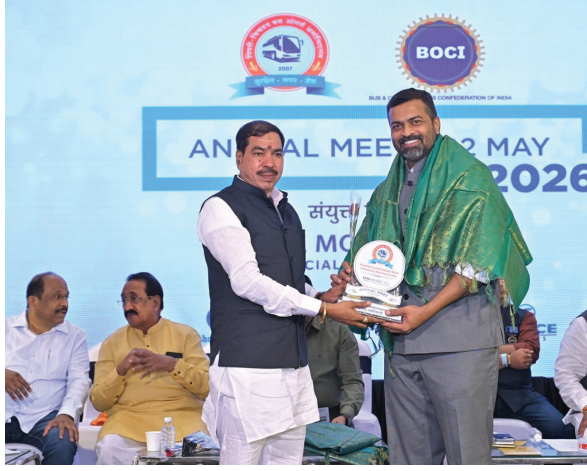
असा इशारा पिंपरी चिंचवड बस ओनर्स असोसिएशनचे अध्यक्ष

चुकीच्या पद्धतीने होणाऱ्या 'इ-चलन' कारवाईतून वाहतूकदारांना मुक्तता मिळावी, यासाठी शासन दरबारी अनेकदा पाठपुरावा केला आहे. यापूर्वी मुंबई, आझाद मैदान येथे आणि पुण्यामध्ये आरटीओ कार्यालयावर वाहन चालकांनी आंदोलन केले आहे. तरी देखील या मुद्द्यावर तोडगा निघाला नाही, 'इ-चलन' कारवाई चुकीची आहे. शासनाने बस मालकांना या त्रासापासून मुक्त करावे, अन्यथा पुन्हा राज्यात बस ओनर्स असोसिएशनच्या वतीने आंदोलनाचा भडका उडेल