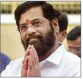
अमित शाहंच्या बैठकीत सकारात्मक तोडगा निघेल

कांदा उत्पादक शेतकऱ्यांच्या प्रश्नावर केंद्र आणि राज्य सरकार पूर्णपणे संवेदनशील असून, केंद्रीय सहकार व गृहमंत्री अमित शाह यांनी बोलावलेल्या बैठकीत निश्चित सकारात्मक तोडगा निघेल, असा ठाम विश्वास उपमुख्यमंत्री एकनाथ शिंदे यांनी व्यक्त केला. मुंबई येथे पत्रकारांशी संवाद साधताना त्यांनी शेतकऱ्यांच्या हितासाठी सरकार कटिबद्ध असल्याचे स्पष्ट केले. शिंदे म्हणाले की, राज्य सरकार आणि केंद्र सरकारने कांदा खरेदी केंद्रे सुरु केली असून सध्या १५ रुपये ८० पैसे प्रति किलो या दराचे कांदा खरेदी केली जात आहे. शेतकऱ्यांना कोणत्याही परिस्थितीत वाऱ्यावर सोडले जाणार नाही. त्यांच्या हितासाठी आवश्यक त्या सर्व उपाययोजना करण्यात येत आहेत. "कांदा उत्पादक शेतकऱ्यांच्या अडचणी सरकारला पूर्णपणे माहीत आहेत. त्यामुळे केंद्र आणि राज्य सरकार समन्वयाने काम करत आहे. उद्या होणाऱ्या बैठकीत अमित शाह यांच्याकडून यावर योग्य तो निर्णय घेतला जाईल आणि शेतकऱ्यांना दिलासा मिळेल," असे शिंदे म्हणाले. विरोधकांच्या आंदोलनांवर टीका