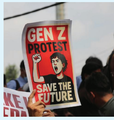
मागणी अधिकाधिक ताकदीने मांडली जाऊ लागली. अखेर शेख हसीना यांना राजीनामा देऊन भारतात यावं लागलं. गेल्यावर्षीच्या सप्टेंबरमध्ये

आले आणि राजपक्षे घराण्याच्या राजवटीला मोठे आव्हान उभं राहिलं. सरकारने हा उठाव दडपण्याचा प्रयत्न केला. मात्र राजपक्षेच्या घरावर लोक चालू न गेले आणि जुलै २०२२ मध्ये राजपक्षेला देश सोडून परागंदा व्हावं लागलं. दोन वर्षांतच बांगलादेशमध्ये लोकसेवा परीक्षांमध्ये आरक्षणाच्या मुद्द्यावर सुरु झालेलं आंदोलन काही काळातच सरकारच्या विरोधात मोठं होऊ लागलं. पंतप्रधान शेख हसीना यांच्यावरच्या असंतोषातून हा उठाव अधिकाधिक आक्रमक होऊ लागला आणि जुलै-ऑगस्ट २०२४ दरम्यान सरकारच्या पुनर्बांधणीची