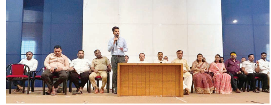
जेजुरी पोलिस स्टेशन व नगरपरिषदेच्या वतीने विविध प्रश्नावर चर्चा करण्यासाठी बैठकीचे आयोजन करण्यात आले होते

जेजुरी पोलिस स्टेशन व नगरपरिषद आयोजित समन्वय बैठकीत जेजुरीत विकला जाणारा भेसळयुक्त भंडारा, व पेढे यावर कारवाई व्हावी, वाहनकर रद्द करावा, पार्किंगची व्यवस्था करावी, चिंचेची बाग प्रशासनाने ताब्यात घ्यावी, स्वच्छतागृहांचा अभाव, जेजुरीची बदनामी थांबवावी, जेजुरी गडावरील अतिक्रमणे त्वरित काढावीत, भाविकांना होणारी अरेरावी मारहाण यावर कारवाई व्हावी आदी प्रश्नाबाबत जेजुरीत नागरिकांनी चर्चा केली. महाराष्ट्राचे कुलदैवत असणाऱ्या खंडोबा देवाच्या जेजुरी नगरीत अलीकडील काळात भाविक व नागरिकांच्या झालेल्या वादाचे व्हिडिओ सोशल मीडियावर व्हायरल झाले होते. यातून जेजुरी शहराची बदनामी होत असल्याने यावर नागरिकांशी चर्चा होऊन उपाययोजना करण्यासाठी जेजुरी पोलिस स्टेशनच्या वतीने येथील महत्त्वाचे नागरिकांच्या बैठकीचे आयोजन करण्यात आले होते.