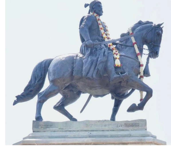
दिन" स्वराज्यगुढी उभारून साजरा करण्यास सुरुवात केली.