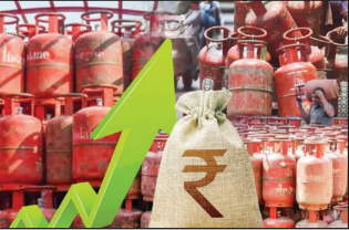
₹89ने दर वाढले; मुंबईत 14.2 किलोचा सिलिंडर ₹941 मध्ये

घरगुती एलपीजी सिलिंडर 29 रुपयांनी महागला आहे. नवीन दर आज रात्री 12 वाजल्यापासून लागू झाले आहेत. दिल्लीत आता 14.2 किलो वजनाच्या गॅस सिलिंडरची किंमत ₹913 वरून ₹942 होईल. तीन महिन्यांत दुसऱ्यांदा एलपीजीच्या किमती वाढवण्यात आल्या आहेत. यापूर्वी 7 मार्च रोजी एलपीजी सिलिंडरचे दर ₹60 ने वाढवण्यात आले होते. अशा प्रकारे 3 महिन्यांच्या आत घरगुती सिलिंडर 89 रुपयांनी महागला आहे. न्यूज एजन्सी पीटीआयच्या सूत्रांनुसार, तेल कंपन्यांचे म्हणणे आहे की, आंतरराष्ट्रीय बाजारात वाढलेल्या ऊर्जा खर्चामुळे आणि घरगुती विक्रीवरील नुकसानीमुळे किमती वाढवाव्या लागल्या आहेत. कंपन्यांना प्रति सिलिंडर ₹703 तोट्याचा दावा न्यूज एजन्सी पीटीआयने सूत्रांच्या हवाल्याने सांगितले की, सरकारी तेल कंपन्यांना अत्यंत घरगुती सिलिंडरवर सुमारे ₹703 चे नुकसान होत होते. किमती वाढवूनही केवळ अंशतः भरपाई होईल. 2026 पूर्वी सरकारने 8 एप्रिल 2025 रोजी घरगुती एलपीजी सिलिंडरच्या दरात ₹50 ची वाढ केली होती. 1 मार्च 2026 रोजी व्यावसायिक गॅस सिलिंडरचे दर ₹31 पर्यंत वाढवण्यात आले होते. 5 किलोग्राम