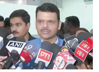
अल निनोमुळे यंदा राज्यात कमी पावसाची शक्यता - मुख्यमंत्री देवेंद्र फडणवीस

"राज्यात आणि देशात सध्या अंमली पदार्थाविरुद्ध 'नो टॉलरन्स फॉर ड्रग्स' ही मोहीम तीव्र गतीने राबवली जात आहे. विविध तपास यंत्रणांच्या माध्यमातून चोख माहिती गोळा करून मोठ्या कारवाया केल्या जात असून, कुठल्याही परिस्थितीत ड्रगच्या काळ्या जाळ्याची पाळेमुळे खणून काढली जातील," अशी ग्वाही मुख्यमंत्री देवेंद्र फडणवीस यांनी दिली आहे. आगामी काळातही या कारवाया सातत्याने सुरू राहतील, असा इशारा त्यांनी अंमली पदार्थ तस्करींना दिला आहे. ते मुंबईत प्रसारमाध्यमांशी बोलत होते. यंदाच्या मान्यबाबत आणि हवामानाच्या स्थितीवर बोलताना मुख्यमंत्र्यांनी शेतकऱ्यांच्या चिंतेची दखल घेतली. ते म्हणाले, यंदाचे वर्ष 'अलिनो'चे असल्याने सरासरी पाऊस ९२ टक्के राहण्याचा अंदाज आहे. सरासरी ९२ टक्के पाऊस असला, तरी मराठवाडा, पश्चिम विदर्भ, उत्तर महाराष्ट्राचे काही जिल्हे आणि राज्यातील आवर्षण प्रवण (दुष्काळी) भागांमध्ये या सरासरीपेक्षाही कमी पाऊस पडण्याची