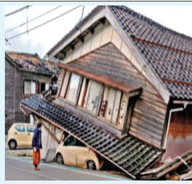
भूकंपापासून घराजवळच्या मोकळ्या जागा शोध. तशीच वेळ आली, तर जीव वाचेल!' तिने जणू आदेशच दिला. 'परवाच्या भूकंपात वाटलं, आता इमारत कोसळणार.. टेबलाखाली जाऊन

'इतके दिवस झाले तरी तू डगमगलास? घराच्या आजूबाजूच्या मोकळ्या जागाही तुला माहित नाहीत? कोपऱ्यावर भाजी घ्यायला निघालास आणि आला भूकंप, तर काय करशील? एक पिशवीच तयार करून ठेव. त्यात खाणं, पाणी, कपडे, औषधं ठेव, आणि शनिवारी इकडेतिकडे