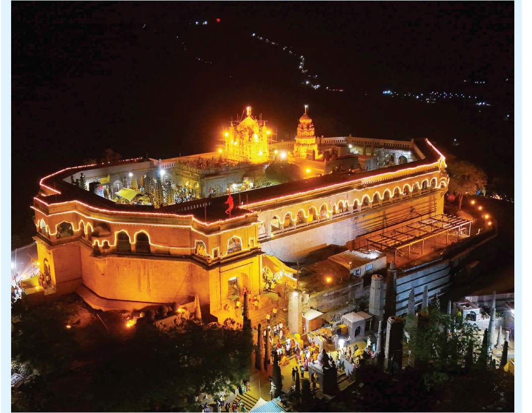
जेजुरी : महाराष्ट्राचे कुलदैवत असणाऱ्या खंडोबा देवाच्या सोमवती अमावस्या यात्रेनिमित्त श्री मार्तंड देवस्थानच्या वतीने जेजुरीच्या खंडोबा गडाला आकर्षक विद्युत रोषणाई व मुख्य गाभाऱ्याला केलेली आकर्षक फुलांची सजावट करण्यात आली आहे.