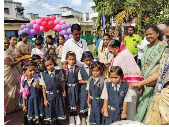
शाळेच्या पहिल्या दिवशी विद्यार्थ्यांच्या धोर वाढावा आणि त्यांच्या मनात शाळेबद्दल गोडी निर्माण व्हावी, यासाठी शिक्षकांनी