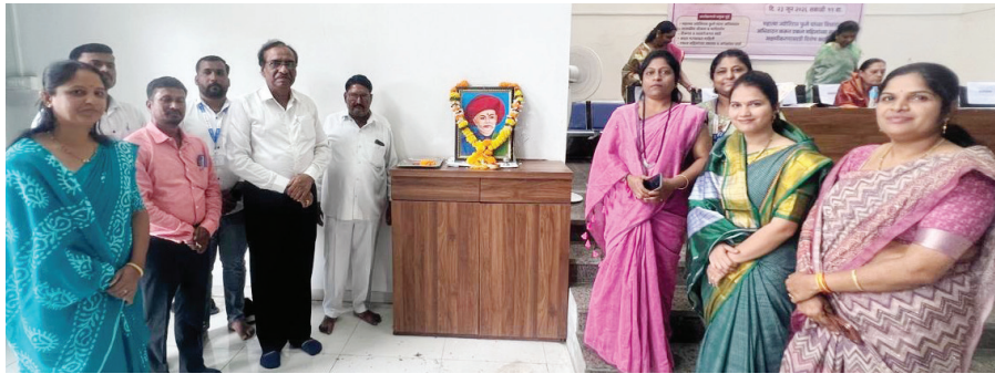
सासवड (ता.पुरंदर) : 'एकल महिला दिन' कार्यक्रमाप्रसंगी उपस्थित पदाधिकारी